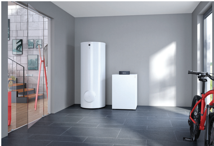
Wärmepumpe Vitocal 200-G mit Speicher-Wassererwärmer Vitocell 100-W (links)

Die preisattraktive Sole/Wasser-Wärmepumpe Vitocal 200-G ist dank ihres leisen Betriebs auch für die wohnraumnahe Aufstellung geeignet.