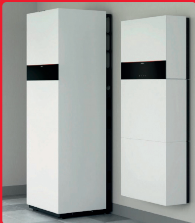
Gas-Hybrid-Anlage (Gasbrennwert + WP) 20.000–25.000 Euro