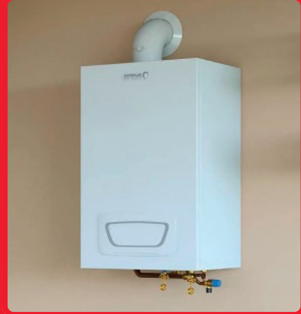
Paket Brötje Gasbrennwert inkl. Schornsteinsanierung 8.000–11.000 Euro inkl. MwSt.