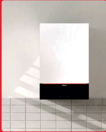
Paket Viessmann Gasbrennwert inkl. Schornsteinsanierung 10.000–13.000 Euro inkl. MwSt.