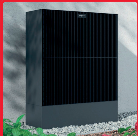
Monoblock-WP Viessmann 12.000–16.000 Euro

Preisstand Januar 2023 – Angebot notwendig