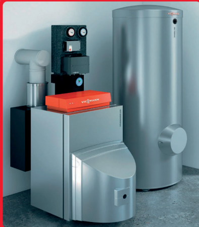
Paket Viessmann Ölbrennwert inkl. Schornsteinsanierung 15.000–18.000 Euro